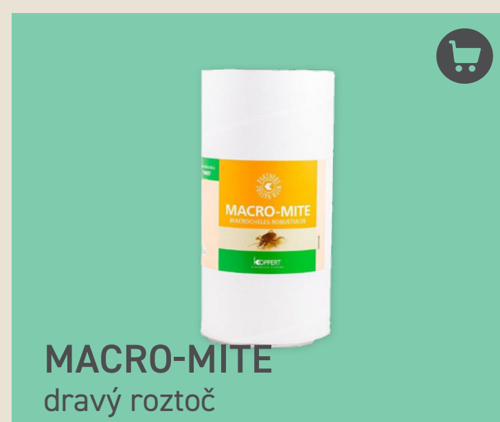
MACRO-MITE dravý roztoč

JEDNO BALENÍ: 250 m 2 MÍSTO : podestýlka APLIKACE: každé 2 až 4 týdny