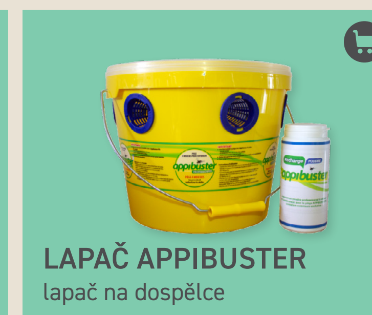
LAPAČ APPIBUSTER lapač na dospělé

JEDNO BALENÍ: 50 g/m 2 MÍSTO : kurník APLIKACE: první 3 dny každý den, poté 1x týdně